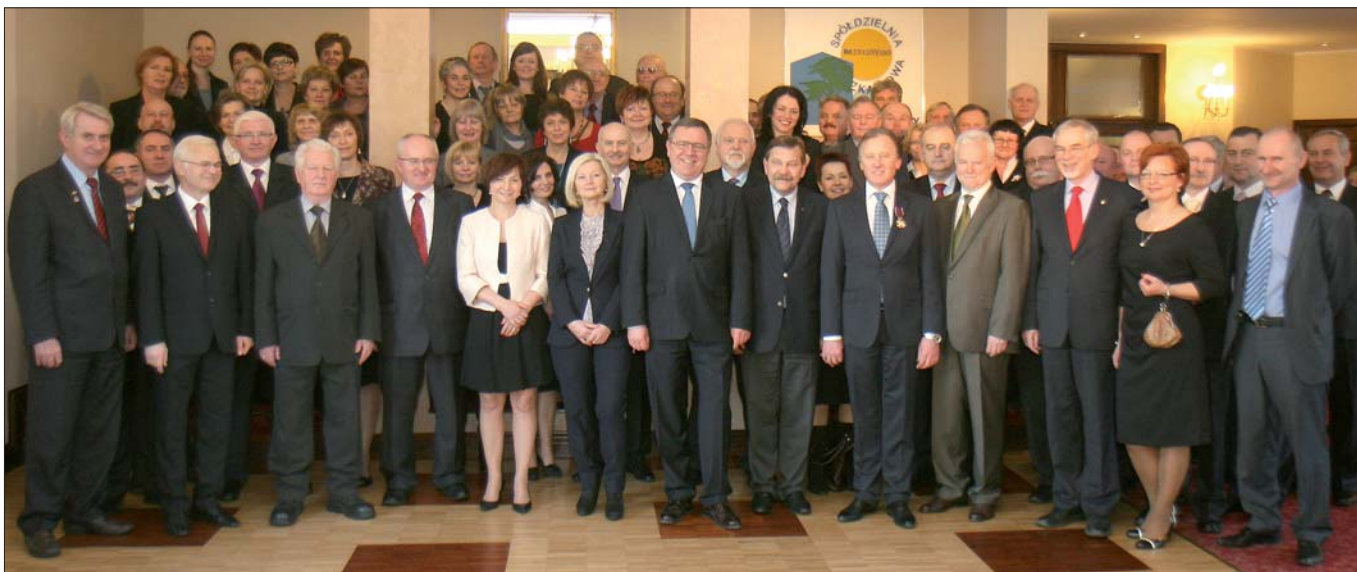
Pracownicy Spółdzielni nie często mają okazję do tak uroczystego spotkania z przedstawicielami władz państwowych, samorządowych i firm współpracujących

Wydawca: Spółdzielnia Mieszkaniowa im. 23 Lutego w Koziegłowach, Os. Leśne 18 A, 62-028 Koziegłowy Adres redakcji: Os. Leśne 18 A, 62-028 Koziegłowy Redaktor naczelny: Waldemar Filipowicz, e-mail: w.filipowicz@kozieglowy.com.pl, tel. 61-811-15-60 Współpraca: Krystyna Potok, Krzysztof Maciejewski, Arkadiusz Sójka. Redakcja nie odpowiada za treść zamieszczanych reklam. Zastrzegamy sobie prawo do redagowania i skracania nadsyłanych tekstów Opracowanie graficzne, komputerowe i druk: UNI-DRUK s.c. Luboń, tel. 61-899-49-49 do 52